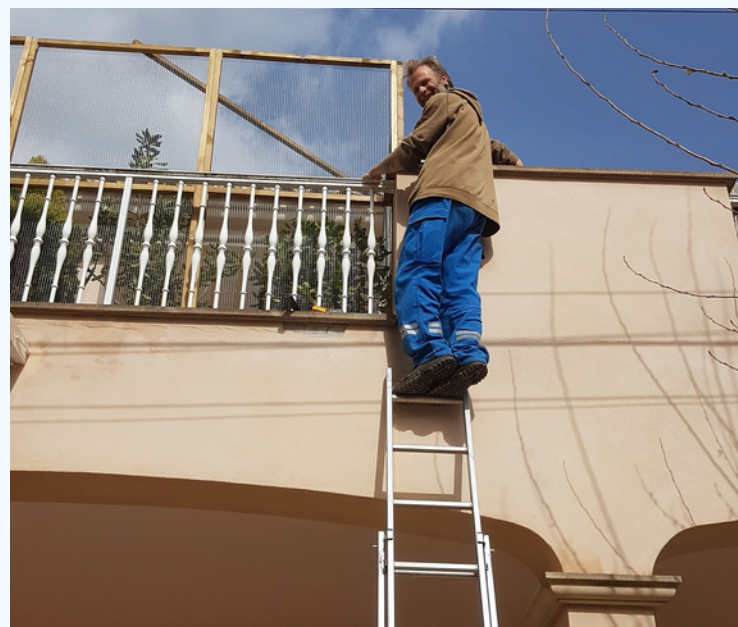
Cerrar una terraza