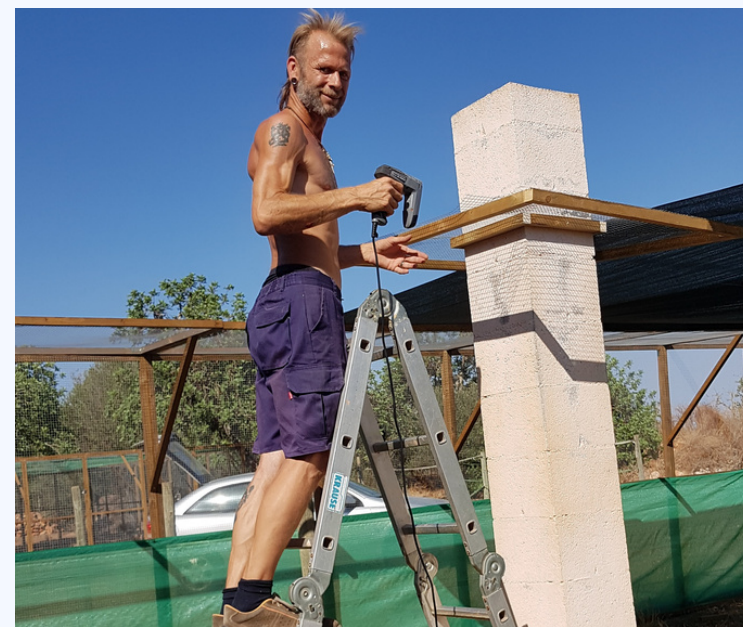
Fijación del toldo solar